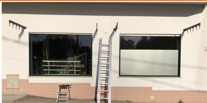
2.1: Definir e confirmar o ângulo da viga (pala)