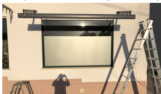
2.3: Montagem das lâminas seguintes