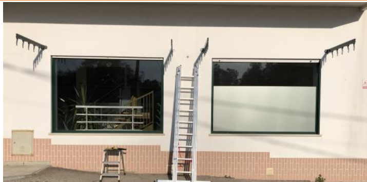
2.1: Definir et confirmer l'angle des traverses